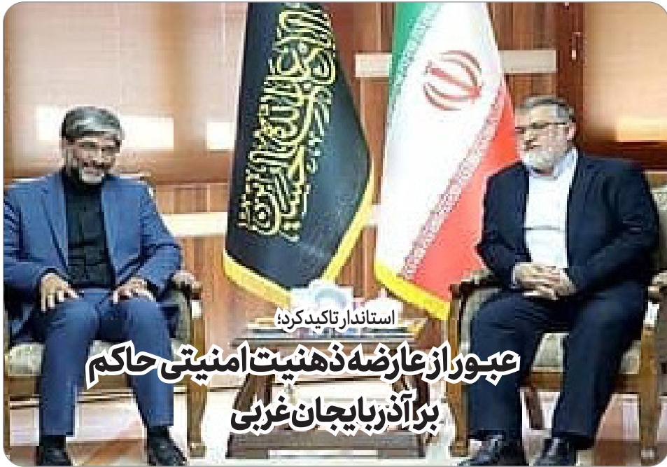
استاندار تاکید کرده؛ عبور از عارضه ذهنیت امنیتی حاکم بر آذربایجان غربی