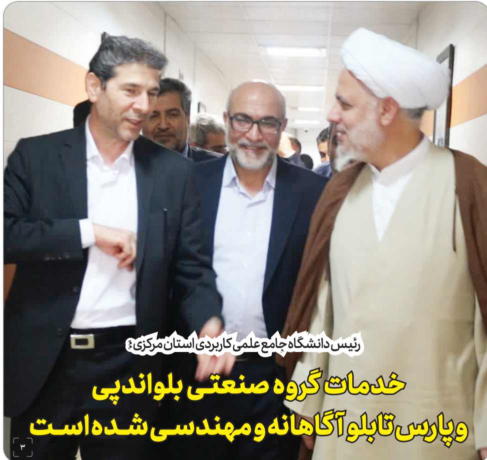
رئیس دانشگاه جامع علمی کاربردی استان مرکزی؟

خدمات گروه صنعتی بلواندپی و پارس تابلو آگهانه و مهندسی شده است