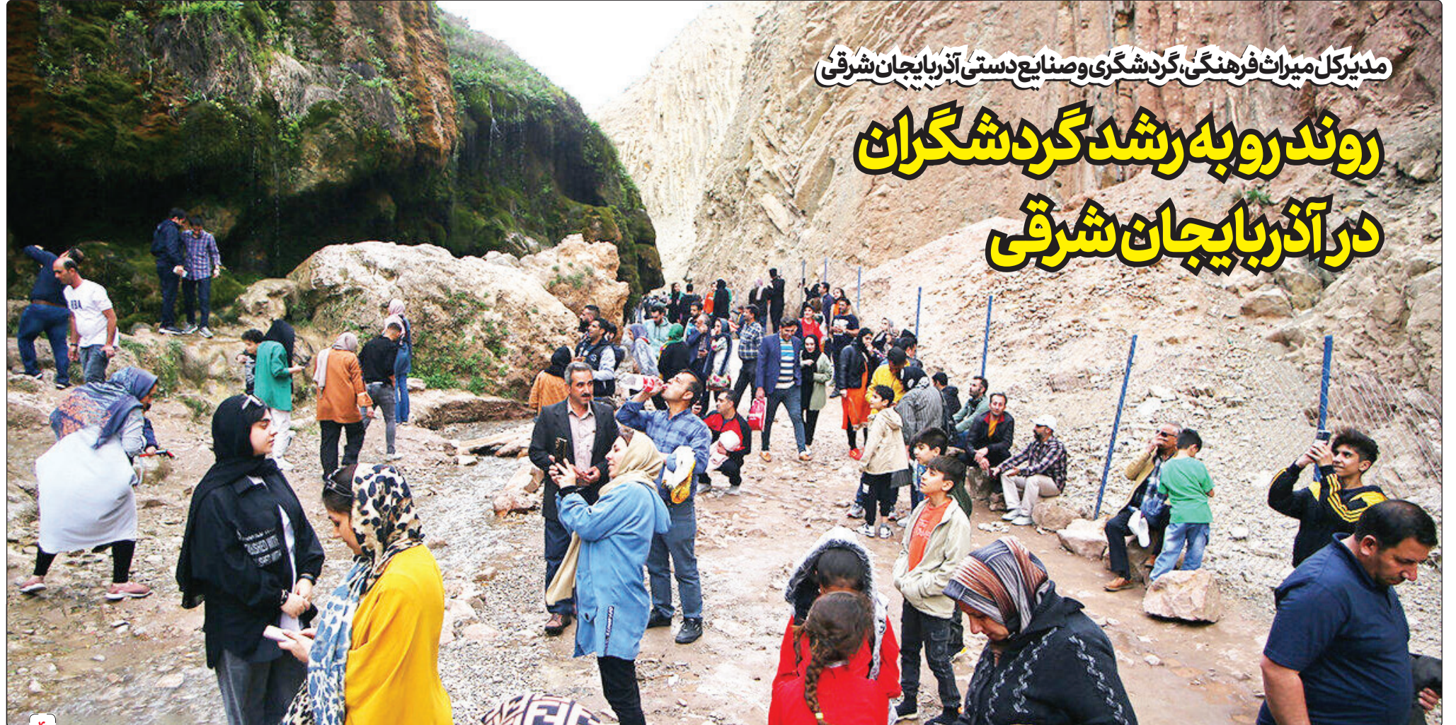
مدیرکل میراث فرهنگی، گردشگری و صنایع دستی آذربایجان شرقی