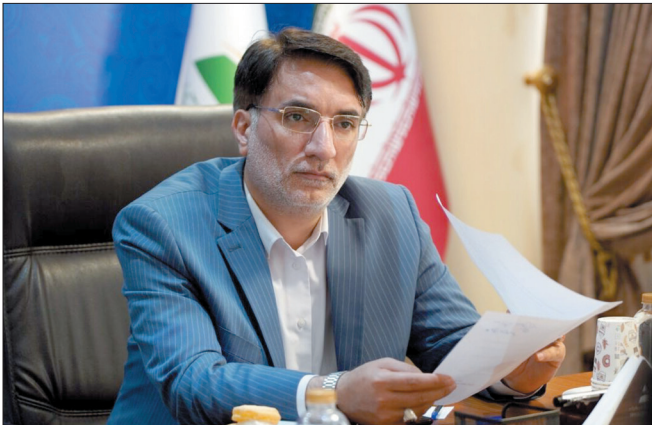
میان صنایع و دانشگاه‌ها، تقویت حضور و همکاری شرکت‌های دانش بنیان در منطقه و تسهیل همکاری مشترک بین سازمان و دانشگاه‌های حاضر در تفاهم از جمله اهدافی

در ۲۰ زن (بخش) صنعتی این منطقه بیش از ۱۵۰ واحد تولیدی و صنعتی فعالیت می‌کنند.