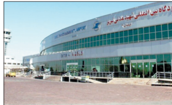
مدیرکل فرودگاه‌های آذربایجان شرقی گفت:

تعداد پروازهای فرودگاه بین‌المللی شهید مدنی تبریز در سال جاری نسبت به مدت مشابه سال گذشته چهار درصد افزایش یافته است.