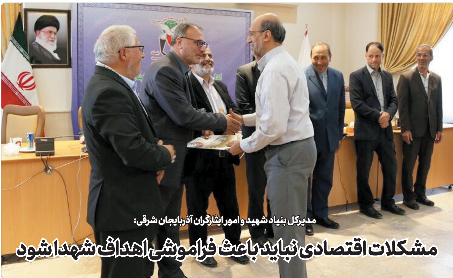
مدیرکل بنیاد شهید و امور ایثارگران آذربایجان شرقی:

مشکلات اقتصادی نباید باعث فراموشی اهداف شهدا شود