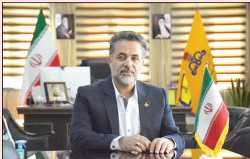
۱۷۳ دیدار مردمی و چهره به چهره با مدیر عامل شرکت گاز استان در ۹ ماه سال ۱۴۰۱ برگزار شد.

کردن مشکلات مردم راه های دسترسی متفاوتی از جمله سامانه سامند، سامانه بازرسی و پاسخگویی به شکایات به آدرس s-bazresi.nigcir، سامانه ۱۹۴ و ۱۵۹۴ و شماره پیامک ۰۹۱۲۴۸۹۶۰، در اختیار شهروندان قرار داده است. بر اساس این خبر ساکنان استان البرز برای طرح و پیگیری مشکلات خود می توانند با گرفتن وقت قبلی روزهای سه شنبه از ساعت ۹ تا ۱۲ یا حضور در دفتر مدیر عامل شرکت گاز استان البرز پیگیر مسائل خود در ارتباط با انرژی گاز باشند.