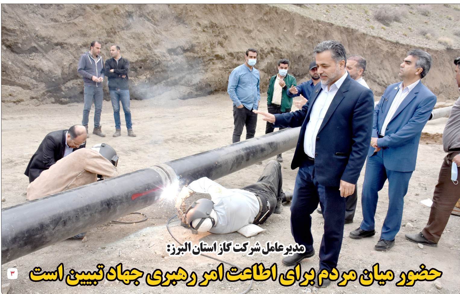
مدیرعامل شرکت گاز استان البرز:

حضور میان مردم برای اطاعت امر رهبری جهاد تبیین است