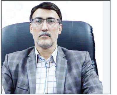
رئیس دانشگاه علوم پزشکی کرمان با بیان این‌که فرهنگ اشتباه فرزندآوری آسیب‌های زیادی داشته است، گفت: با اقدامات انجام‌شده نرخ باروری در استان کرمان رشد داشته است.