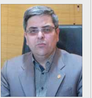
شعب بانک کشاورزی استان آذربایجان شرقی، در راستای حمایت از بخش کشاورزی در سال ۹۶ بالغ بر ۱۴۵۰۰ میلیارد ریال تسهیلات پرداخت

وی دریابان به طرح های کارآفرینی صندوق توسعه ملی اشاره کرد و گفت: طی سال گذشته بالغ بر ۲۵ میلیارد ریال به این طرح از محل صندوق توسعه ملی و منابع داخلی بانک بانرخ سود ۱۳ درصد و بازپرداخت بلندمدت پرداخت گردید.