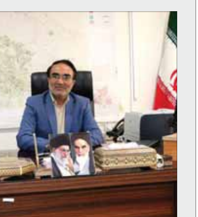
معاون قضایی و سرپرست معاونت اجتماعی و پیشگیری از وقوع جرم دادگستری کل استان آذربایجان شرقی بر لزوم فرهنگ سازی برای اعمال مجازاتهای