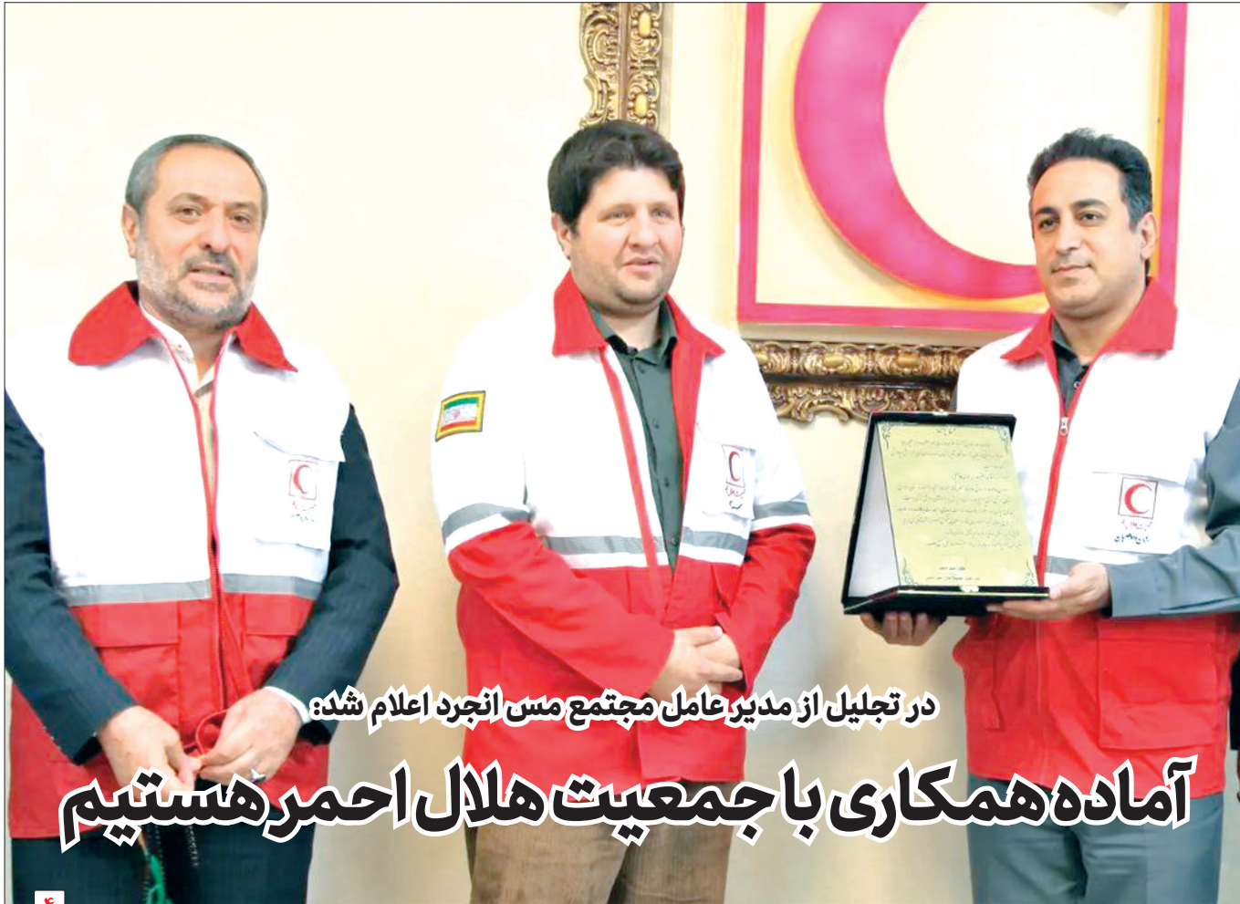
در تجلیل از مدیر عامل مجتمع مس انجرد اعلام شد: