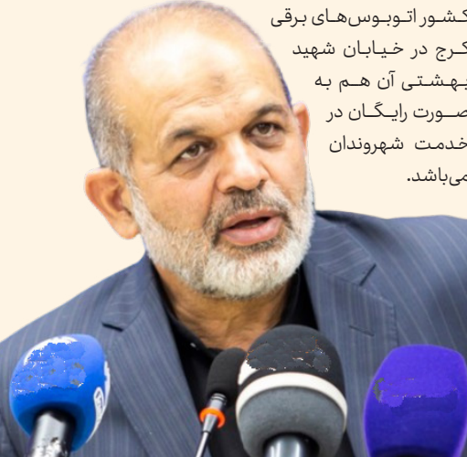
کشور اتوبوس‌های برقی کرج در خیابان شهید بهشتی آن هم به صورت رایگان در خدمت شهروندان می‌باشد.

وزیر کشور گفت: توسعه ناوگان حمل و نقل برقی از کرج به تمام کشور ضرورت دارد. او افزود: باید تأکید کنم شهر کرج این فرصت را داشته که اولین شهری باشد که از نعمت اتوبوس محیط‌زیستی برقی استفاده کند.