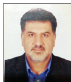
رامین شاه حسینی(امام ماهر)

شیخ بهائی را می‌توان یکی از پر درخشان ترین نگین آسمان معرفت و گسترده دانش دوران صفوی و اعصار پس از آن دانست. او که متولد بعلبک بود، کودکی خود را در جبل عامل لبنان در خاندان معروفی که نیای آن‌ها به حارث همدانی(از یاران حضرت علی(ع) در جنگ صفین) می‌رسد، گذرانیده و پدر او شیخ عزالدین حسین عاملی از شاگردان بر جسته شهید ثانی به خاطر آزار و اذیت دولت عثمانی، دعوت شاه طهماسب صفوی را لیبک گفته و زمانی که شیخ بهائی طفلی ۱۳ساله بود به همراه خانواده از جبل عامل به قزوین مهاجرت و چهار سال بعد به شیخ الاسلامی قزوین منصوب و ۱۴