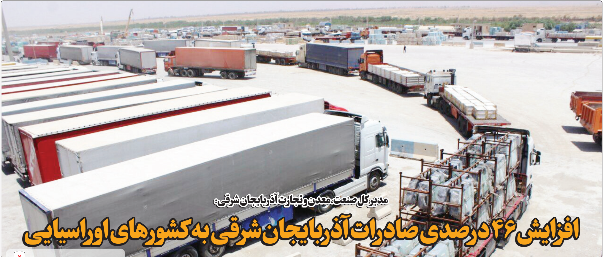
مدیرکل صنعت، معدن و تجارت آذربایجان شرقی: