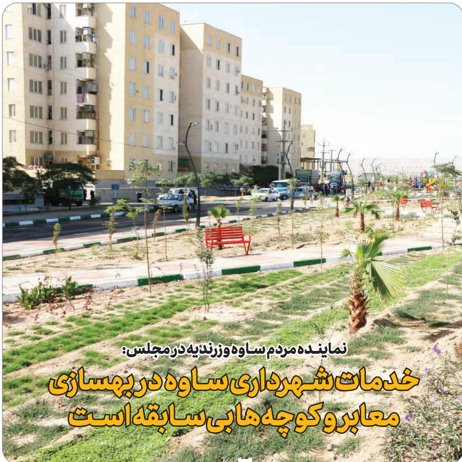
نماینده مردم ساوه وزرنديه در مجلس: