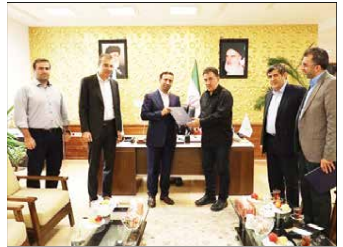
شهردار تبریز از انعقاد قرارداد اجرایی ایجاد بستر فیبر نوری شهری بین شهرداری تبریز با شرکت خدمات ارتباطی ایرانسل به طول ۲۰ کیلومتر خبر داد.

شهردار تبریز اجرای این پروژه را در راستای تحقق بسترهای شهر هوشمند عنوان کرد و افزود: در این بین شهرداری تبریز نیز از هفته آینده عملیات اجرای ۷۰