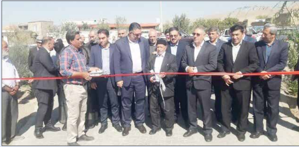
حضور به موقع و سریع دولت در صحنه‌های خدمت‌رسانی و تأکید کرد و گفت: دولت در تلاش است که رضایت مردمی رضایت حداکثری در جامعه، در این است که هیچ شکافی بین

وی هدف دولت را کمک به همه شهرداری‌ها در راستای ارتقای کیفی و کمی خدمت‌رسانی به مردم و شهرها عنوان کرد و بر