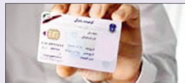
رئیس پلیس راهور البرز گفت: در سال گذشته تعداد ۶۰۷۵۴ نفر موفق به طی مراحل اخذ گواهینامه شده‌اند

از دریافت گواهینامه و حضور یک راننده دارند گواهینامه پایه دوم یا یکم یا دارند گواهینامه پایه سوم که مشمول محدودیت‌های مذکور نمی‌باشد و هم‌راه وی عدم ارتکاب تخلفات حادثه ساز دارای نمره منفی موضوع جدول ماده ۷ قانون رسیدگی به تخلفات رانندگی عدم رانندگی از ساعت ۲۴ تا ۵ صبح ممنوعیت رانندگی در معابر برون شهری و رانندگی حداکثر تا شعاع ۱۵ کیلومتری شهرها و ... در صورت ارتکاب محدودیت‌های فوق همچنین در صورت