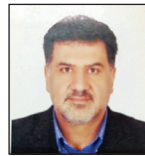
امیرحسین راحمی شاعر

روزگاری ما دل صاحب قراری داشتیم یاد گیسوی همیشه در بهاری داشتیم تا که خورشید جهان رو جانب یلدا کشید ما قراری با نگاری در کناری داشتیم از خیالش تا ابد آه از نهاد ما برفت روز و شب اندر پی لیل و نهاری داشتیم تیغ مزگانتش به آب دیده صیقل کرده بود کشته‌های بیشمارش را شماری داشتیم جامه تقوی اگر ناموس عصمت می‌درید خلعتی زیباتر از هر نونواری داشتیم جامع دردی کشان، چشمی به ساغر بسته اند ما که چشمی گوشه ی چشم خماری داشتیم گوشه ی میخانه ی ما شاید این نوبت شود چشم امید بر آن لطف نگاری داشتیم آن چه خوبان جملگی هر یک جدا می‌داشتند جمله کی ما یک نشانی زین تباری داشتیم دل حریم حرمت باریتعالی بوده است یادگاری از جناب شهریار داشتیم باغبانی باید این دل را که گلزاری شود و نه نه چون یک بیابان خارزاری داشتیم اقتضای ما در این دنیا به آدم بودن است ما که صد آدم نما را گیر و داری داشتیم خوب اگر بد می‌شود، باید به اصلاحش رسید آدم بد ذات را باید، فراری داشتیم شرم و انصاف و مروت می‌دهد ما را کمال قدر خود می‌دان که ما قدری وقاری داشتیم راه اگر پیچیده و دشمن اگر هر سو نهان دست ما دست خدا و، ذوالفقاری داشتیم چون بهار ما گذشت و گرد پیری می‌رسد شاید این نو چون بهار، نو بهاری داشتیم چاره ی پیری، شراب و صحبت نوباوگان گوشه ی دنج و ریاب و غمگساری داشتیم صحبت دلدار، دل را چون جوانان می‌کند روی و موی پیری ما، و سوسه کاری داشتیم