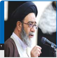
روزنامه فرهنگی، اجتماعی صبح ایران