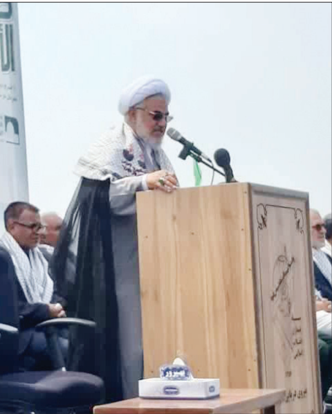
خواهند زد و عوامل نابودی و عوامل فلاکت و بدبختی آن‌ها را فراهم خواهند کرد.

ایزوایکو شده بود. لازم به ذکر است که در روند تعویض سیل‌های شافت این شناور برای نخستین بار در کشور با تاقان‌های شافت RECONDITION شده که در نوع خود منحصر بفرد بود. سومین شناور آنداک شده در این عملیات شناور چند منظوره عسلونیه بود که با ابعاد ۳۸ متر طول، ۹ متر عرض و ۵ متر آب‌خور، تعمیراتی شامل ۶۰۰ متر تعویض لوله، اورهال کامل ۹۸ عدد ولو، تعمیرات وینچ لنگر، ژنراتور، میگزتست ۴۰ عدد الکترو موتور و رنگ و سند بلاست بدنه، عرشه و مخازن آب را در درای داک ایزوایکو با بالاترین کیفیت تجربه کرد. تصاویر این‌گونه تعمیرات علاوه بر جلوگیری از مقادیر قابل توجهی ارز، می‌تواند منجر به ایجاد اشتغال پایدار در منطقه شود از همین رو نقش ایزوایکو به عنوان یک صنعت استراتژیک و پشتیبان در این میان بسیار حائز اهمیت بوده و هست.