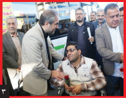
روزنامه فرهنگی، اجتماعی صبح ایران