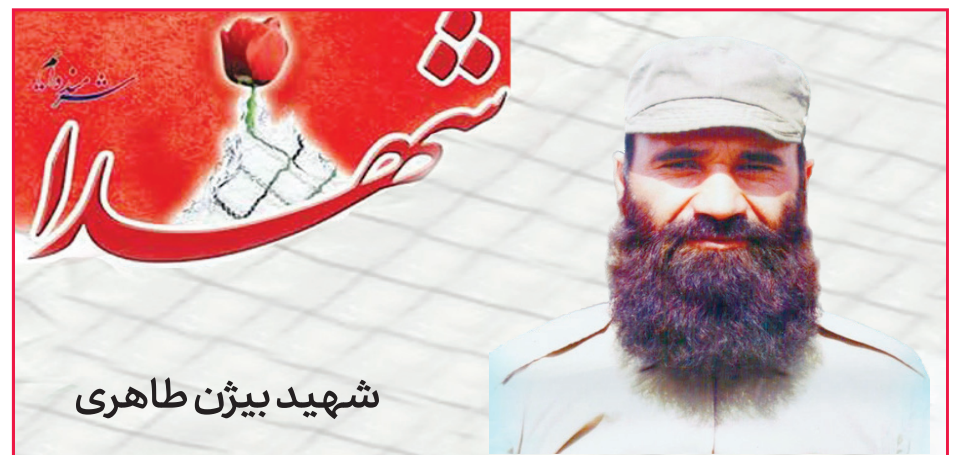
شهید بیژن طاهری