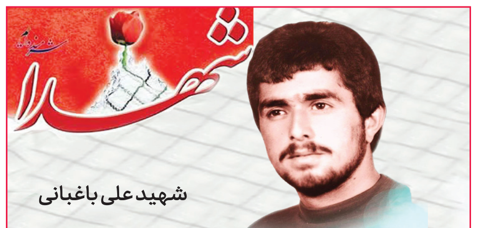
شهید علی باغبانی