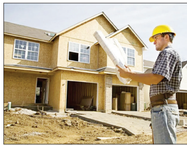
استان تهران نسبت به کل کشور، شایسته است نماینده مجلس از اختیارات نظارتی خود بهره‌مند شود و ریشه بسیاری از فسادها را بکشد.

تخلفات ساختمانی و برخی سازنده‌های متخلف، نبود سرانه فضای سبز، آموزشی، فرهنگی، ورزشی، پارکینگ و ... دومین آسیبی است که به دلیل افزایش تراکم غیر قانونی به شهرها و شهروندان وارد می‌شود. کمبود امکانات، زمینه ساز انواع بزهکاری، دعوا و حتی فحشا می‌شود و همه این مفاسد اقتصادی و اجتماعی، بخاطر کوتاهی شهرداران در نظارت و ثروت اندوزی غیر مشروع به اصطلاح سرمایه گذاران متخلف در حوزه مسکن است. اصلاح این نابسامانی باید در مجلس و در سطح ملی پیگیری شود اما با توجه به رکورد زنی این نابسامانی در غرب