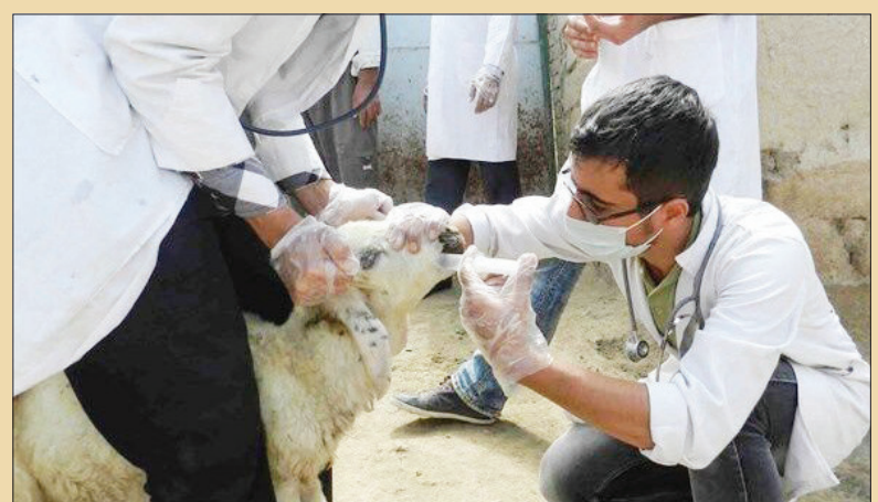
مدیرکل دامپزشکی استان آذربایجان شرقی گفت: همزمان با دهه فجر امسال، بیش از ۱۱۱ گروه به ۲۰۰ روستای این استان اعزام می‌شوند و خدمات دامپزشکی آذربایجان شرقی با بیان این‌که در تمام

شهرستان‌های استان هماهنگی‌های لازم برای ارائه خدمات رایگان انجام شده است، افزود: خدمات واکسیناسیون، سم‌پاشی، معاینه و درمان از جمله خدماتی است که به روستاییان و بهره‌برداران ارائه می‌شود. وی با بیان این‌که از تمام ظرفیت دامپزشکان بخش خصوصی برای ارائه خدمات رایگان از جمله درمان و دارو در دهه فجر امسال بهره گرفته می‌شود، افزود: شورای مرکزی نظام دامپزشکی استان نیز با همکاری ۸۰۰ دامپزشک