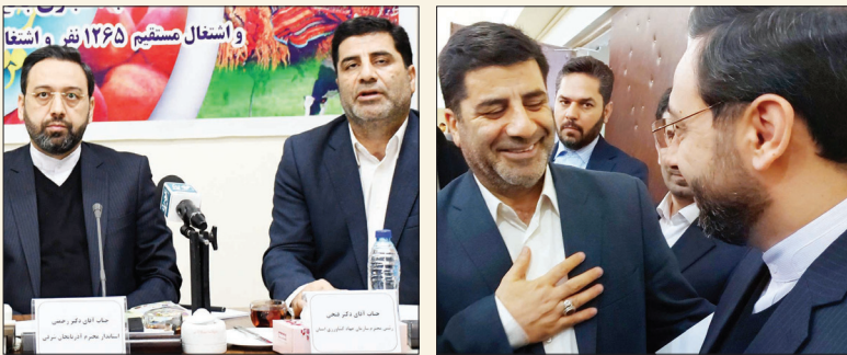
تقدیر استاندار از جهادکشاورزی آذربایجان شرقی درخصوص تأمین کالاهای اساسی و شرقی

استاندار آذربایجان شرقی با اهدای لوح یادگانه ای به رئیس سازمان جهادکشاورزی استان آذربایجان شرقی و معاون بازرگانی و صنایع کشاورزی سازمان جهاد کشاورزی استان از تلاشهای ارزشمند سازمان جهادکشاورزی استان آذربایجان شرقی در اجرای مصوبات و تصمیمات کمیته اقدام مشترک کارگروه تنظیم بازار استان و همکاری در تأمین، توزیع مناسب و به موقع کالاهای اساسی و همچنین نظارت بر بازار و کنترل قیمت‌ها تجلیل نمود.