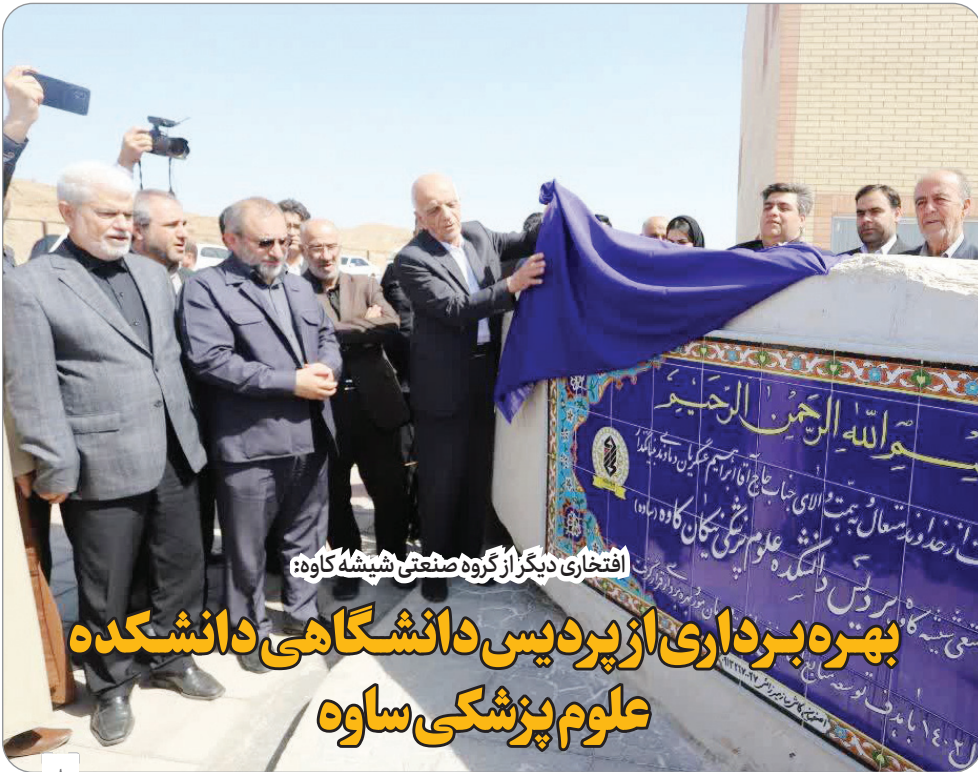
افتخاری دیگر از گروه صنعتی شیشه کاوه: