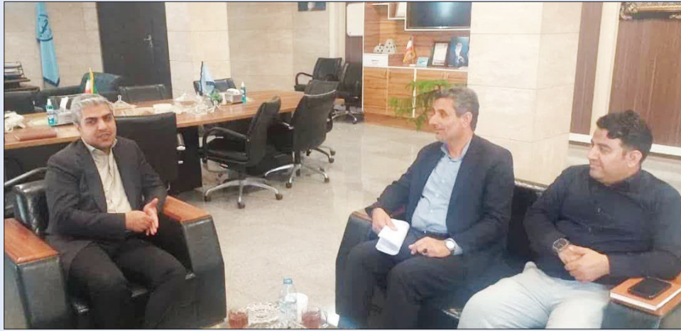
درآمد ساحل نشینان، ارزآوری و گسترش صنعت در بخش های آبرزی پروری و صادرات از مهمترین برنامه های شیلات مدیرکل شیلات هرمزگان با بیان اینکه شیلات محور سرمایه