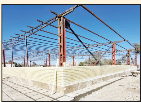
سالن اجتماعات بهشت زهرا