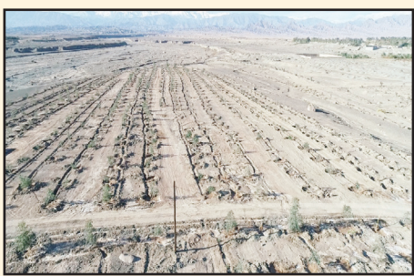
اجرای طرح جنگل کاری بیابان‌های شرق شهر اندوهجرد به مساحت ۱۰ هکتار

شهرداری و استفاده بهینه از امکانات درصدد محقق کردن چشم انداز و برنامه توسعه شهرمان هستیم و انشاءالله بزودی نتیجه تمام تلاش‌های همکارانم در شهرداری را خواهیم دید و مردم نیز این حرکت را کاملاً مشاهده میکنند و همین مورد باعث امید و پویایی در جامعه شهری مان شده و اندوهجرد در آینده‌ای نزدیک حرف‌های زیادی برای گفتن خواهد داشت در زمینه‌های شهرسازی، باغداری، کشاورزی و خواهد توانست به عنوان یک قطب در شهرستان کرمان جزو شهرهای معین باشد