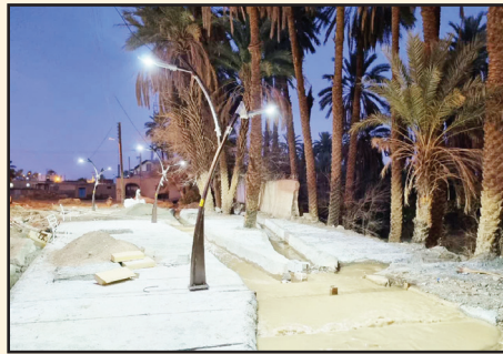
نهر پارک ورزش