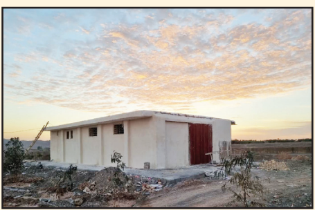
کشتار گاه نیمه صنعتی