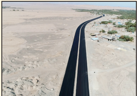
بلوار آیت الله خامنه‌ای به مساحت ۶۰ هزار متر مربع