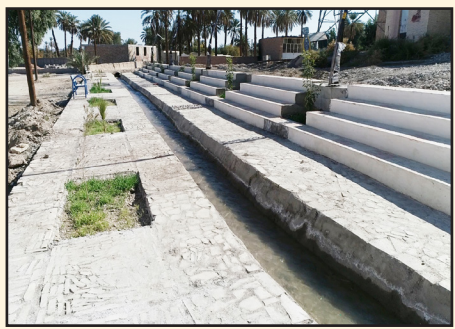
نهر پارک امام جمعه