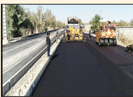
بلوار آیت الله خامنه‌ای به مساحت ۶۰ هزار متر مربع